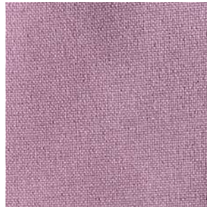
PALO DE ROSA