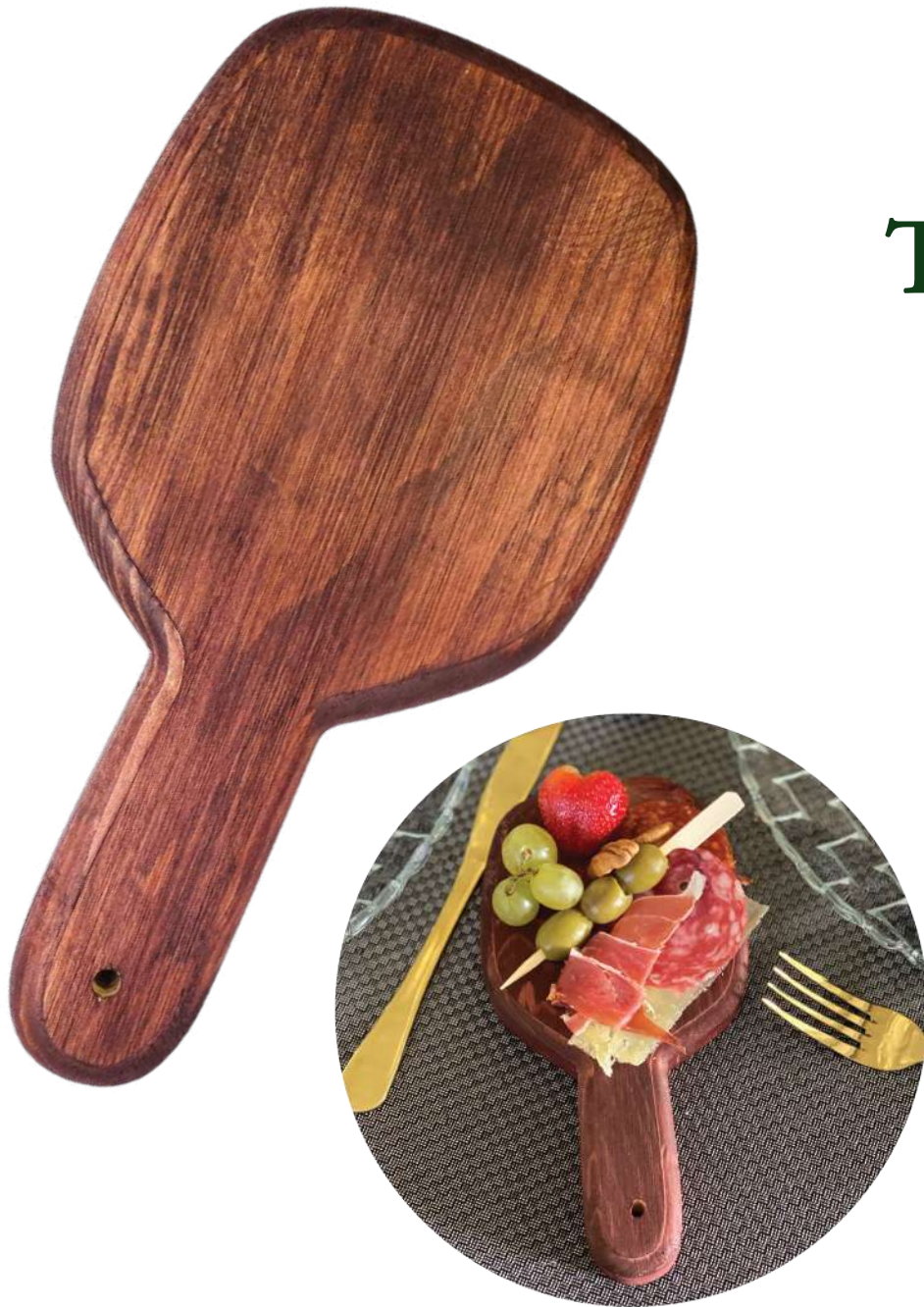
TABLA PANERA INDIVIDUAL