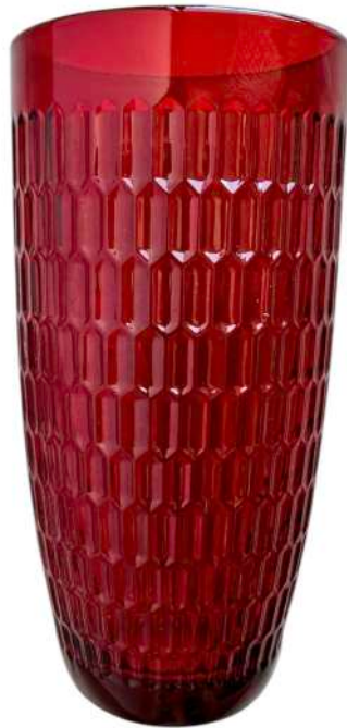
ROJO 37 pzs

Costo: $10.00 Reposición: $120.00 Material: Cristal